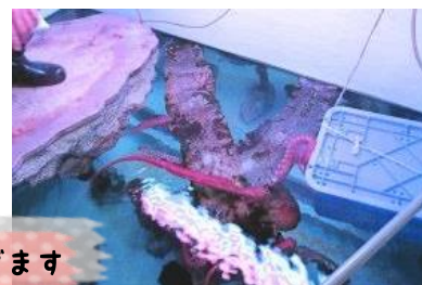
タコの餌は吸盤においてあげます