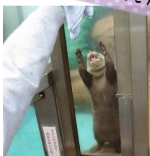
ときにはこんな可愛い出会いも