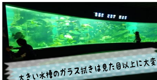
大きい水槽のガラス拭きは見た目以上に大変！

作業の主な内容は、観覧スペースにある水槽のガラスや壁の水拭きですが、通常では入れない水族館の裏側で生き物に餌やりをすることもあります。